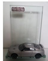
3 e prijs NRF-klasse

Alle MAC De Wâlders/-sters hartelijk dank voor jullie inzet.